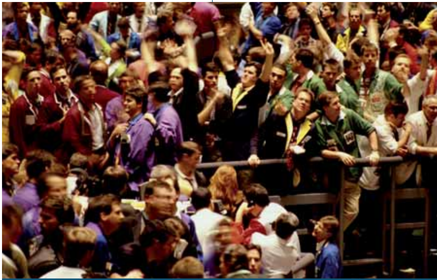
2.4. Las situaciones de riesgo en la empresa son habituales, los empresarios deben estar preparados para gestionarlas de forma eficiente.