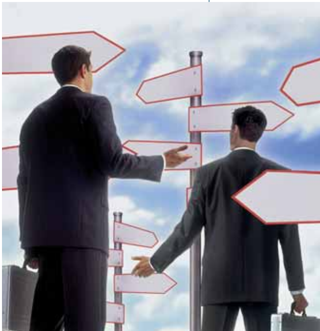
2.3. El riesgo se realiza cuando la situación que se da en el futuro no es la misma que se tuvo en cuenta para tomar la decisión.